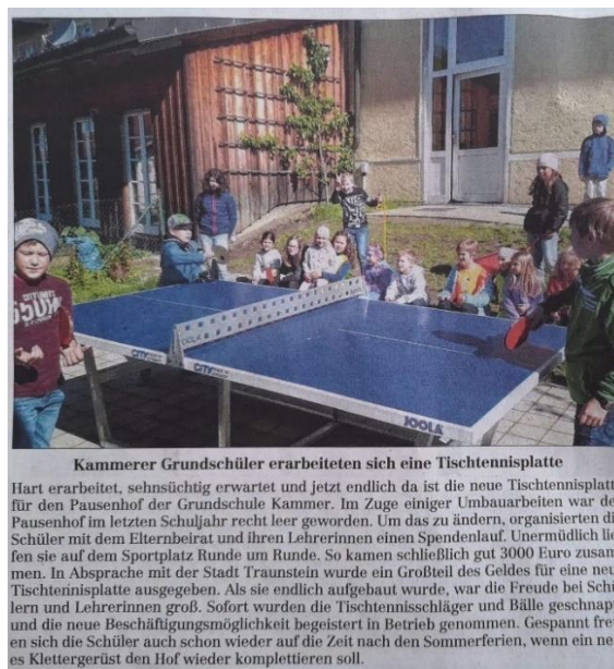
Kammerer Grundschüler erarbeiteten sich eine Tischtennisplatte

Wir bedanken uns nochmals bei allen fleißigen Läufern und Spendern.